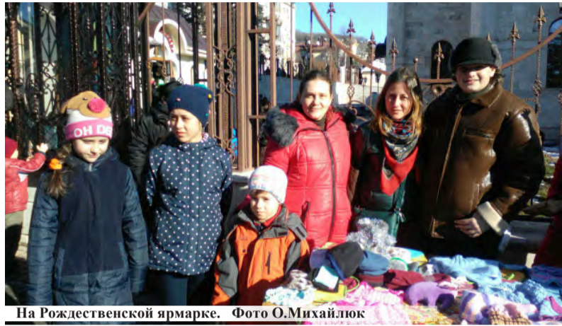
На Рождественской ярмарке.