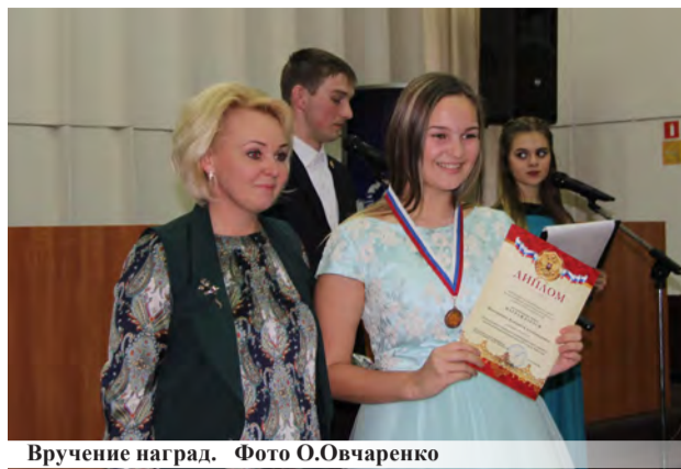
Вручение наград.