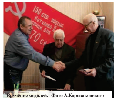
Вручение медалей.

– Отрасли уже 70 лет. В городе все меньше остается тех, кто трудился на заводе и благодаря кому рос и развивался город. Очень приятно, что лермонтовчане отмечены руководством