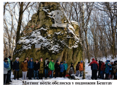
Митинг возле обелиска у подножия Бештау

Перед торжественным открытием обелиска в 1977 году состоялась первая Эстафета поколений, в которой участвовали ветераны Великой Отечественной войны, спортсмены, студенты и школьники. Они доставили