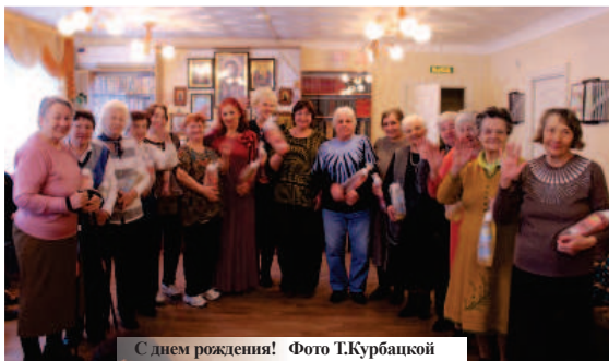
С днем рождения!

29 февраля в Лермонтовском комплексном центре социального обслуживания населения состоялся праздник в честь тех, кто отмечает свой день рождения зимой.