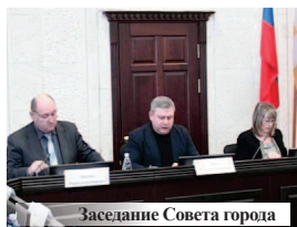
Заседание Совета города

24 февраля состоялась очередное заседание Совета города Лермонтова.