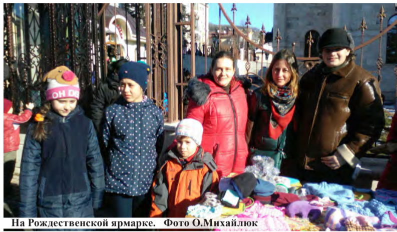
На Рождественской ярмарке.