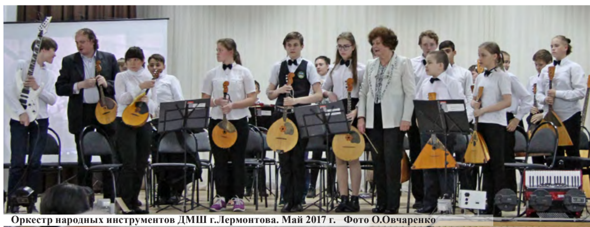
Оркестр народных инструментов ДМШ г.Лермонтова. Май 2017 г.

В 1987 году на смену педагогическому создается детский оркестр