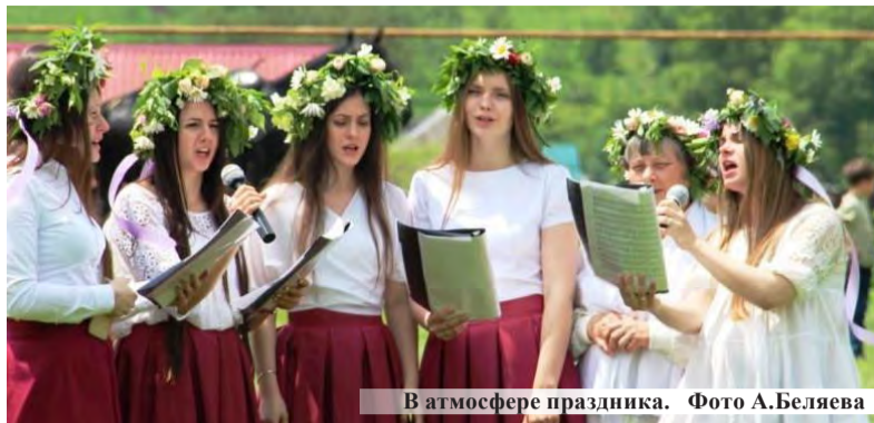
В атмосфере праздника.

4 июня, в православный праздник Святой Троицы, в приходе Казанской иконы Божией Матери села Юца состоялся традиционный праздник Троицкие встречи, на который были приглашены воспитанники и воспитатели воскресных школ храмов Пятигорска и Лермонтова, жители села Юца – участниками встреч стали 320 человек.