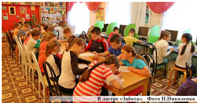
В лагере «Забота».

наблюдением взрослых, заняты интересными и полезными делами, к тому же вкусно накормлены.