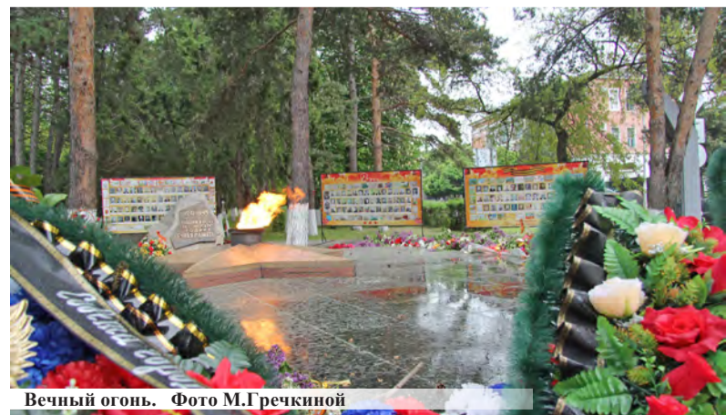
Вечный огонь.

сии по Ставропольскому краю, как и другие лермонтовчане, возложили цветы к мемориалу воинам, павшим в Великой Отечественной войне.