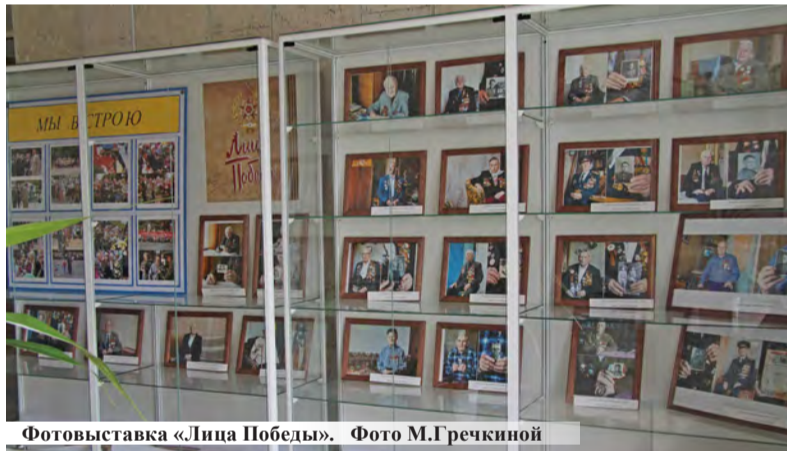
Фотовыставка «Лица Победы».

Фотовыставка «Подвиги ставропольцев», подготовленная с использованием документов Государственного архива Ставропольского края, посвящена ставропольчанам – участникам крупнейших сражений Великой Отечественной войны: Сталинградской битвы, битвы за Ле-