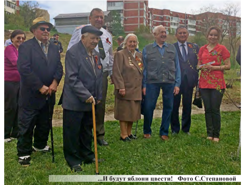
...И будут яблони цвести!