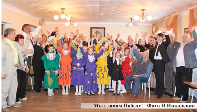
Мы славим Победу!

В клубе «Золотой возраст» Лермонтовского комплексного центра социального обслуживания населения состоялись праздничные мероприятия «Слава Тебе, Солдат Победитель!», посвященные 72 годовщине Великой Победы.