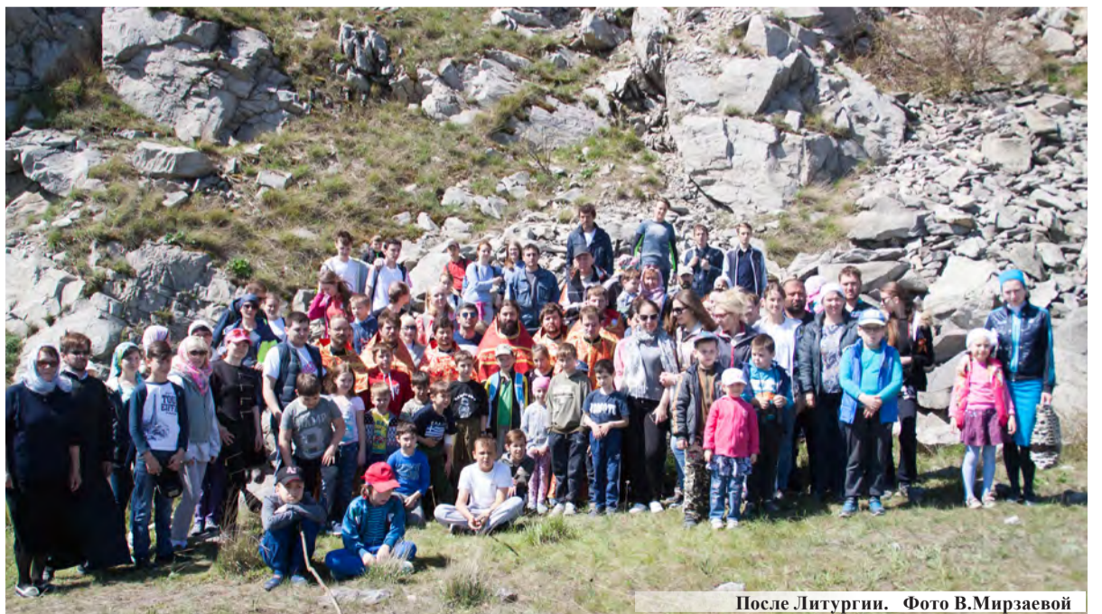
После Литургии.

В Лермонтове в здании городской администрации сотрудники полиции совместно с общественниками организовали торжественное вручение юным гражданам, достигшим 14-летнего возраста, первых в их жизни паспортов Российской Федерации. Церемонию вручения проводила и.о. начальника