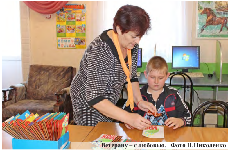
Ветерану – с любовью.

День Победы 9 Мая – важный и знаменательный праздник для всех граждан нашей страны, ведь почти в каждой семье хранят память о предках, сделавших свой вклад в Великую победу над фашистскими захватчиками.