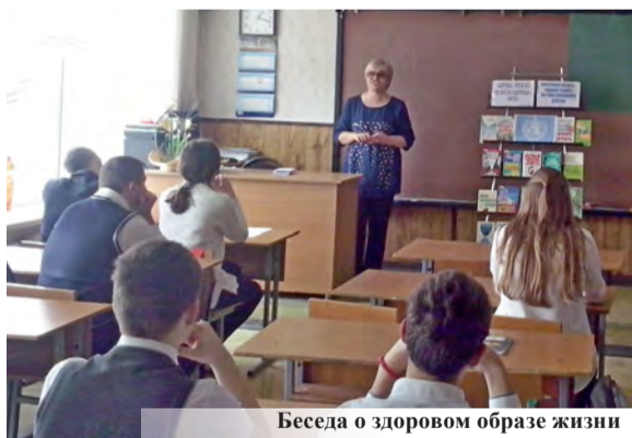
Беседа о здоровом образе жизни

«Здоровье – не всё, но всё без здоровья – ничто,» – сказал великий Сократ. Когда ты здоров, хочется все, и все получается, и все приносит радость. Поэтому забота о здоровье должна стать главным делом каждого.