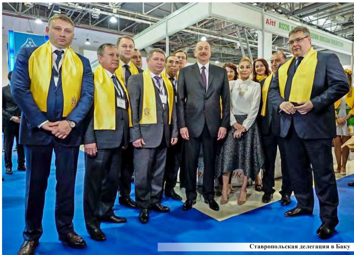
Ставропольская делегация в Баку