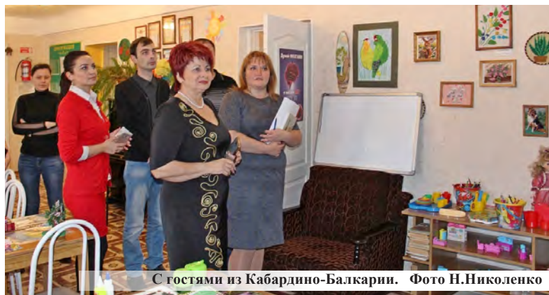
С гостями из Кабардино-Балкарии.

юдную пользу, способствует развитию дружеских отношений и профессиональному росту.