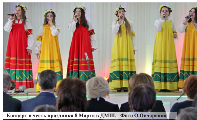
Концерт в честь праздника 8 Марта в ДМШ.